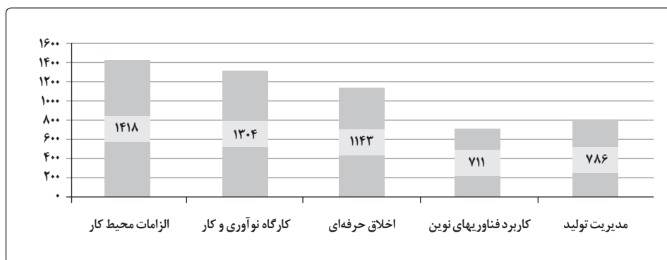
نمودار ۱. میزان کل فراوانی توجه به مؤلفه‌های تربیت حرفه‌ای در کتابهای درسی دوره دوم متوسطه فنی و کار دانش

براساس جدول شماره ۲، مجموع فراوانی مؤلفه‌های مفهومی تحلیل شده در کتابهای شایستگیهای غیرفنی ۵۳۵۵ مورد است که از میان شاخصهای تربیتی تحلیل شده بیشترین توجه به مؤلفه دانش کسب کار با ۱۹۲۳ فراوانی و ۳۵/۹۱ درصد بوده و کمترین توجه به نگرش اقتصادی با ۱۶۵۴ فراوانی و ۳۰/۸۸ درصد بوده است. توضیحات بیشتر در نمودار ۱ آمده است.