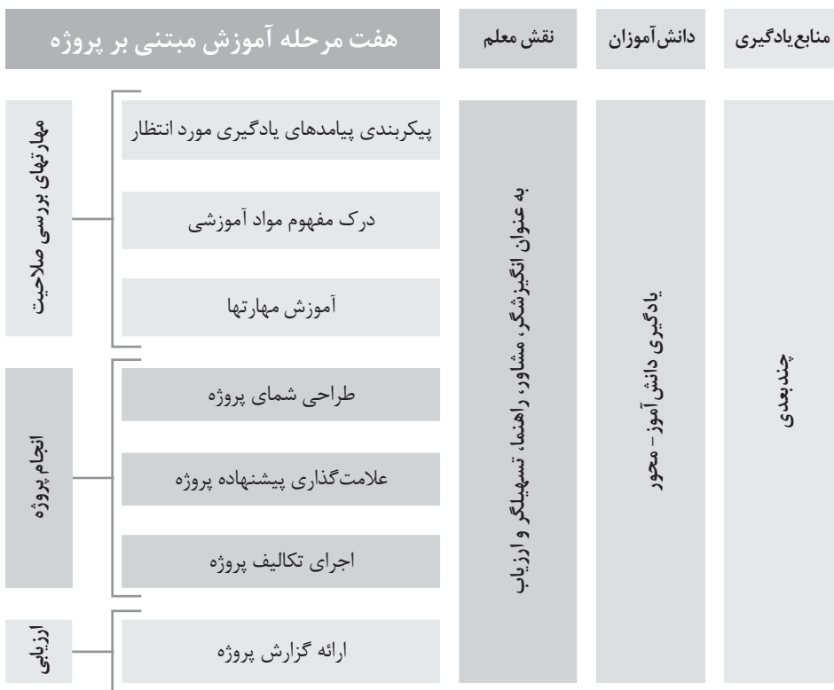
شکل ۱. مدل هفت مرحله‌ای یادگیری مبتنی بر پروژه (به نقل از جالینوس، نبوی و ماردین، ۲۰۱۷)

در ضمن نتایج بررسی‌ها نشان می‌دهد که در روش آموزش مبتنی بر پروژه، فراگیران به تمرین آموزشی، پاسخهای مثبت می‌دهند و این مسئله منجر به افزایش خودکارآمدی معلمان می‌شود (چوی، لی و کیم، ۲۰۱۹).