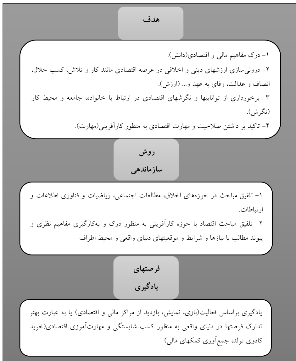
شکل ۲: مرحله مقایسه و تطبیق

و سرانجام در مرحله مقایسه و تطبیق، ویژگیهای آموزشی نواحی مورد مطالعه با ناحیه خود (کشور ایران) مورد مقایسه و انطباق قرار می‌گیرد (معدن‌دار آرانی و کاکیا، ۱۳۹۷). لذا مؤلفه‌های مستخرج از برنامه‌های درسی و اسناد آموزشی کشورهای چین، اسکاتلند، استرالیا و ایران پس از طی مراحل مذکور در الگوی بردی در قالب شکل ۲ ارائه شده است.