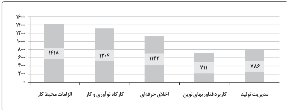
نمودار ۱. میزان کل فراوانی توجه به مؤلفه‌های تربیت حرفه‌ای در کتابهای درسی دوره دوم متوسطه فنی و کار دانش

براساس جدول شماره ۲، مجموع فراوانی مؤلفه‌های مفهومی تحلیل شده در کتابهای شایستگیهای غیرفنی ۵۳۵۵ مورد است که از میان شاخصهای تربیتی تحلیل شده بیشترین توجه به مؤلفه دانش کسب کار با ۱۹۲۳ فراوانی و ۳۵/۹۱ درصد بوده و کمترین توجه به نگرش اقتصادی با ۱۶۵۴ فراوانی و ۳۰/۸۸ درصد بوده است. توضیحات بیشتر در نمودار ۱ آمده است.