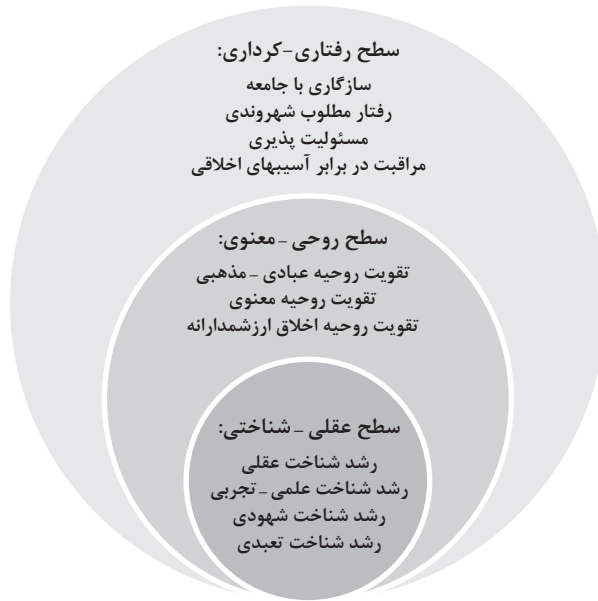
شکل ۲. الگوی مفهومی دلالت‌های برنامه‌های تربیت اخلاقی دانش‌آموزان برای زندگی آینده

در پاسخ به سؤال سوم می‌توان گفت که الگوی دلالت‌های برنامه‌های تربیت اخلاقی دانش‌آموزان برای زندگی آینده مشتمل بر مقوله‌های رفتار مطلوب شهروندی، سازگاری با جامعه، مسئولیت‌پذیری و مراقبت در برابر آسیب‌های اخلاقی بوده است که نتیجه کدگذاریهای محوری و سنتز پژوهی سطح تعالی رفتاری - کرداری است که در جدول شماره ۵ نشان داده شده است.