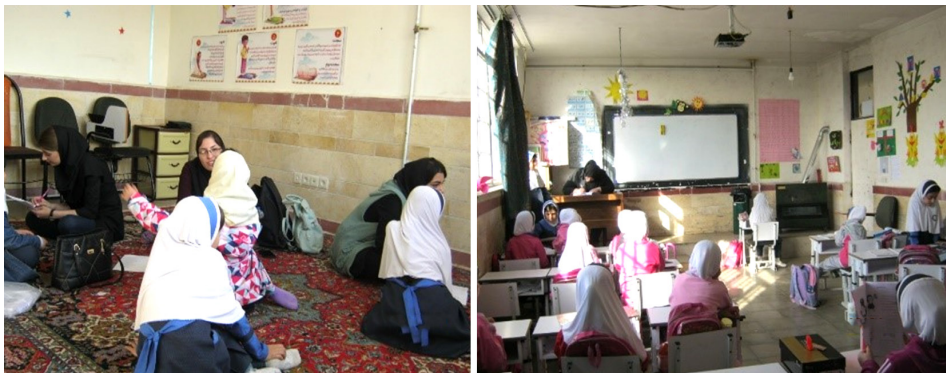
شکل ۲. توزیع پرسشنامه در میان دانش‌آموزان

روش پژوهش حاضر، توصیفی-همبستگی است و جامعه آماری آن را همهٔ دانش‌آموزان مدارس دولتی منطقه ۲ شهر اردبیل تشکیل می‌دادند که از میان آنان ۲۹۱ دانش‌آموز دختر و پسر پایهٔ اول تا پنجم ابتدایی، با استفاده از جدول مورگان ۱ ، به‌عنوان نمونه انتخاب شده‌اند و پرسشنامهٔ مربوطه میان آنان توزیع شده است. فرایند اخذ اطلاعات را پژوهشگر به‌صورت کنترل‌شده در محل انجام داده است و فرضیه‌های پژوهش با استفاده از نرم‌افزار آماری SPSS23 تجزیه و تحلیل شده‌اند.