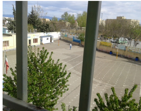
شکل ۳. عدم رعایت سرانه فضای سبز در مدارس

در تحلیل های آماری نیز این گونه بیان می شود که در آزمون همبستگی، کارکردهای فضای سبز محیط آموزشی با عملکرد تحصیلی رابطه ای معنادار دارد، به گونه ای که فضای سبز می تواند در پیش بینی عملکرد تحصیلی مؤثر باشد. آن چنان که کارکرد اکولوژیکی فضای سبز با ابعاد عملکرد تحصیلی