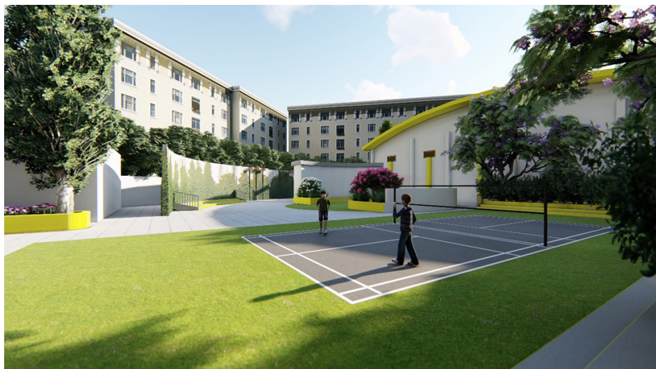
شکل ۴. ضرورت وجود فضای سبز در مدارس

در نهایت اینکه این امر نیازمند توجه مضاعف متولیان ساخت‌وساز مدارس و خیرین مدرسه‌ساز به متغیرها و زیرشاخصهای معماری فضای سبز است و باید در زمینه کیفیت طراحی مدارس در ابعاد مختلف تجدیدنظر کنند.