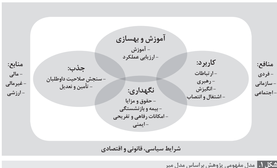
شکل ۱. مدل مفهومی پژوهش براساس مدل میر