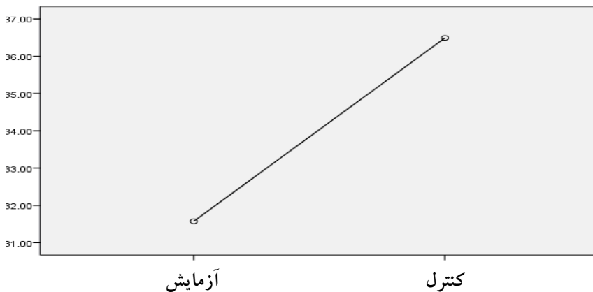
نمودار شماره ۳. میانگین گروههای آزمایش و کنترل در نمره اضطراب پس از تعدیل