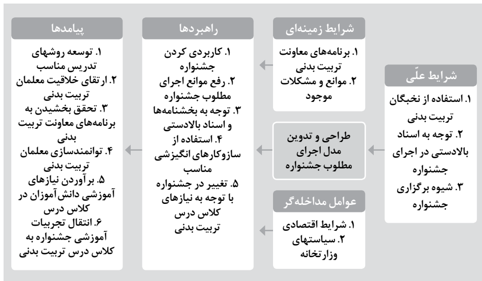
شکل ۲. الگوی کیفی جشنواره الگوهای برتر تدریس مبتنی بر نظریه داده‌بنیاد

در نهایت، مدل نهایی پژوهش استخراج شد که در شکل شماره ۲ ارائه شده است. در این مدل، مفاهیمی انتزاعی‌تر قابل مشاهده است که در آن عوامل علی، زمینه‌ای، مداخله‌گر، راهبردها و پیامدهای اجرای جشنواره الگوهای تدریس درس تربیت‌بدنی مشخص شده‌اند.